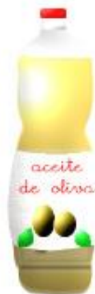
ACEITE DE OLIVA