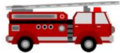
CAMIÓN DE BOMBEROS