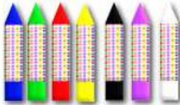
LÁPICES DE CERA