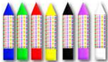
PINTURA DE DEDOS