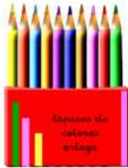
LÁPICES DE COLORES