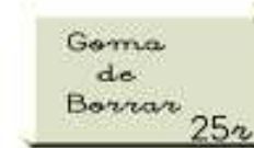
UNA GOMA DE BORRAR