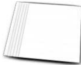
HOJAS DE PAPEL