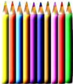
LÁPICES DE COLORES