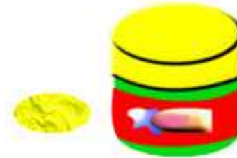
PINTURA DE DEDOS